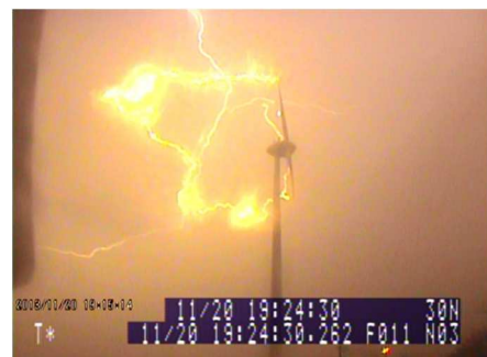
落雷の光学観測画像の例