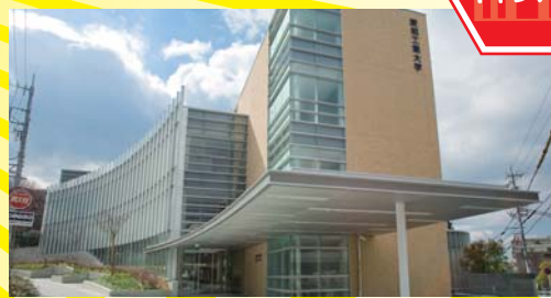
本年4月に経営学部の2専攻のキャンパスとして開設。全館超高速有線と無線LAN設備、CATVを完備し、1階には学生支援オフィス、就職相談室の他、マルチメディア情報センター(図書室)、ラウンジ、カフェなど一般開放ゾーンを設け、「地域に開かれた緑のキャンパス」となっています。

昨年の開学50周年関連事業として建設した名古屋市自由ヶ丘の「自由ヶ丘キャンパス」、八草キャンパスの「新1号館」を本学同窓生の皆様へお披露目すると共に、学内の各施設や学生の研究発表を見ていただく見学会を開催致します。この機会にご家族や同級生をお誘い合わせの上、懐かしのキャンパスへお越しください。