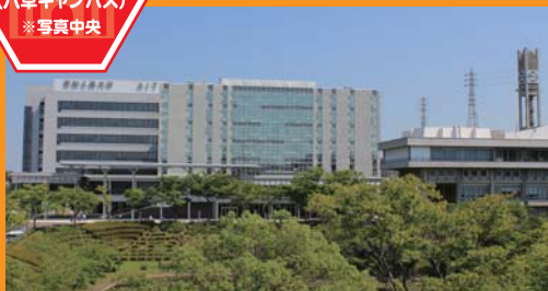
本年9月オープン予定。1階は学生同士が気軽に交流できるカフェやラウンジ、2階にはキャリアセンター、メディアセンター、レンタルルームを設け、キャンパスの新しいコミュニケーションの場が生まれます。6～7階はメディア情報専攻が使用する最先端のパソコン機器やソフトが揃うコンピュータ・グラフィック制作工房となります。