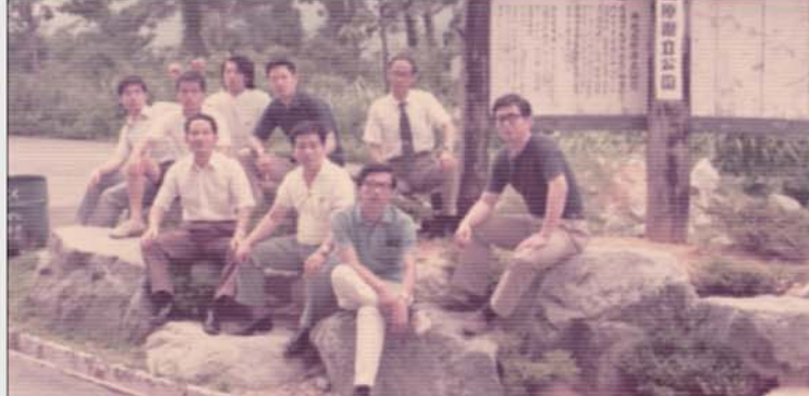
1973年 土木親睦会旅行のひとつ