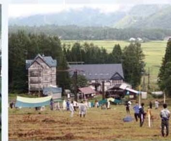
白馬での測量実習