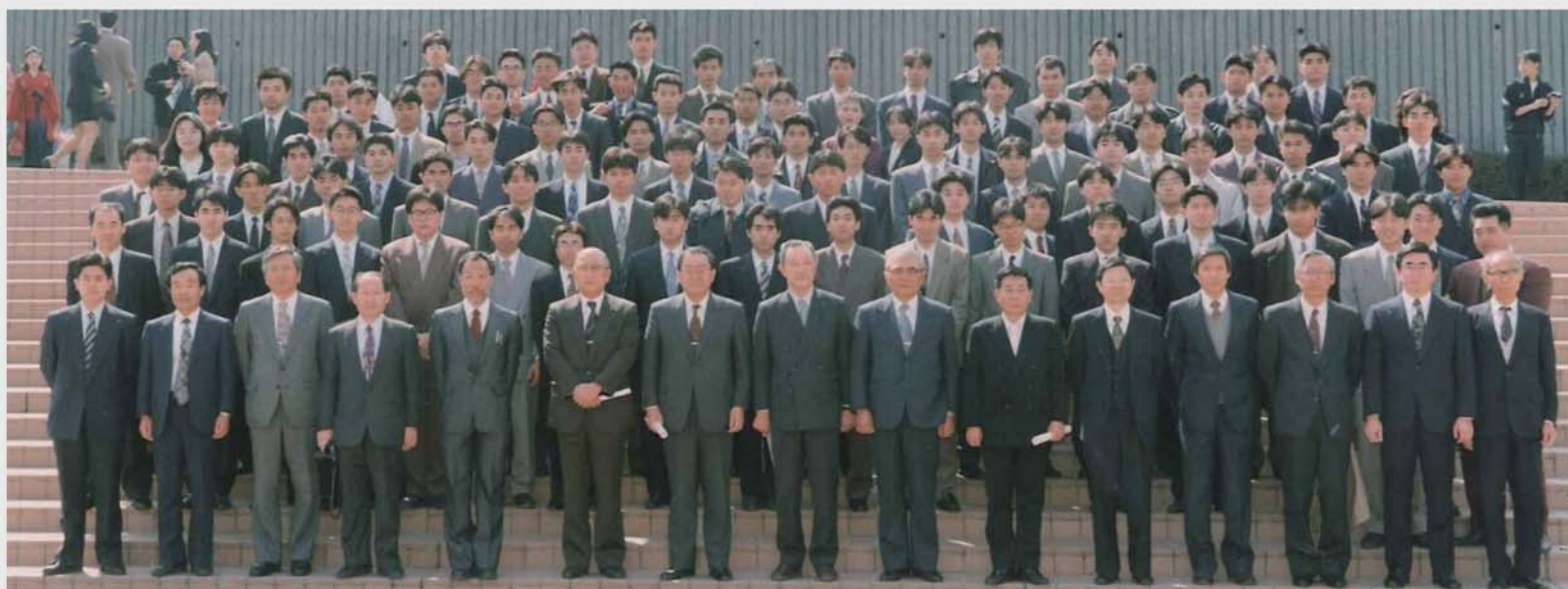
1992年度 卒業式にて 記念写真