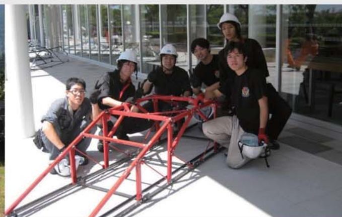
2010年 スチールブリッジコンペティション