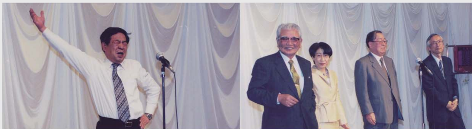
2000年度 土木工学科 卒業祝賀会にて