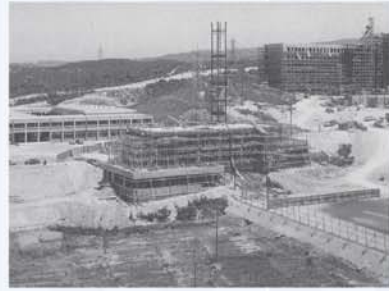
建設中の本部棟と2号館