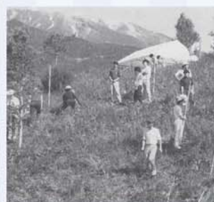
御岳山麓での測量実習