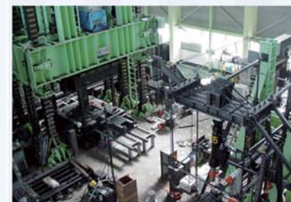
耐震実験センター