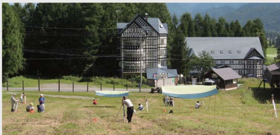
2008年度 測量合宿(第30回)in 白馬村